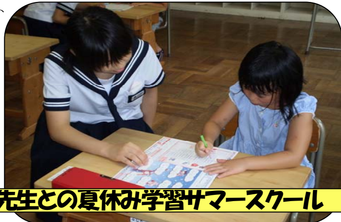
中学生先生との夏休み学習サマースクール