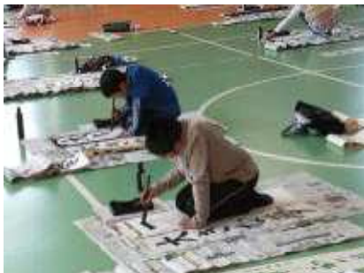
大きな夢を託して書く5年生