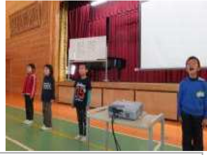
2年生の元気なあいさつが響く