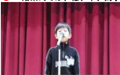
逆上がりと発表をがんばります