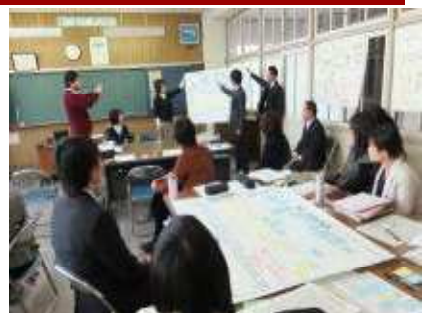
来年度の細江小学校のよりよい教育のあり方について職員全員で話し合いました