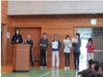
先生方が「ありがとう」のお話を映像とともに紹介