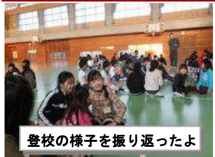
登校の様子を振り返ったよ