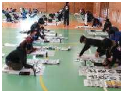
心を込めて力いっぱい6年生