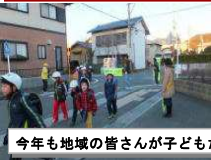
今年も地域の皆さんが子どもたちの安全を見守ってくれます