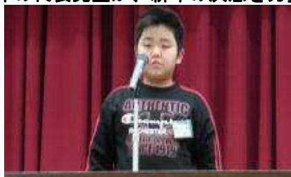
長縄をがんばります