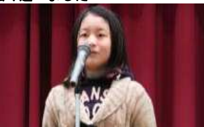
長縄と発表をがんばります