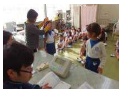
おもちを食べて大きくなったかな