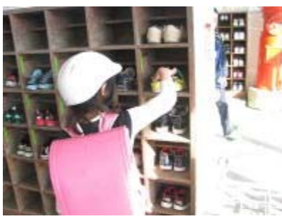
靴のかかとをそろえます