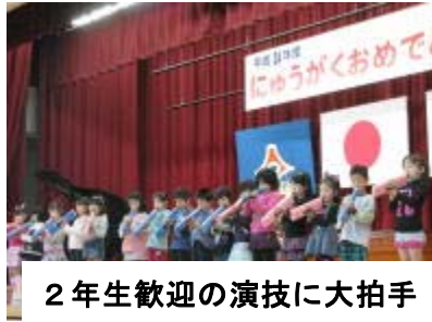
2年生歓迎の演技に大拍手