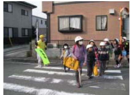
見守り支援ありがとうございます