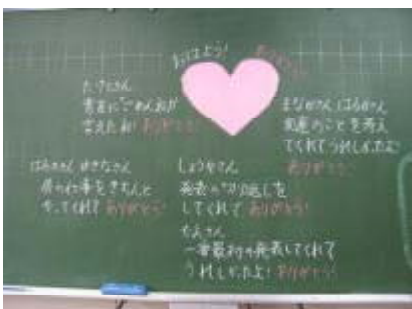
子どものよさを広めるおはよう黒板