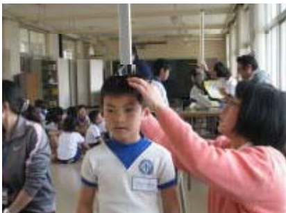
身体測定 大きくなったかな