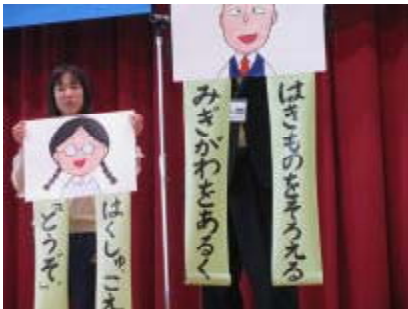
ステージ集会で目指す姿の提案