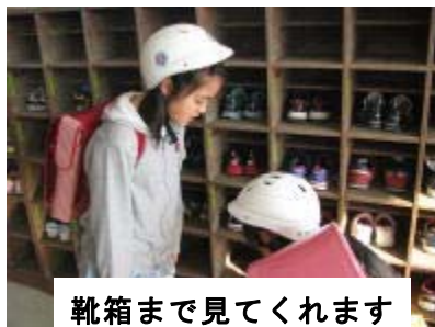
靴箱まで見てくれます