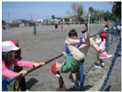
進んで、運動しています