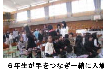
6年生が手をつなぎ一緒に入場