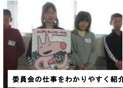
委員会の仕事をわかりやすく紹介