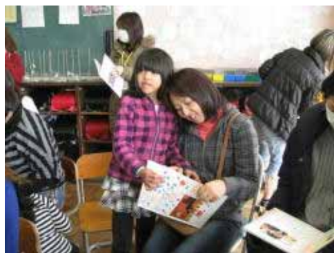
おかあさんに作品を見せる2年生