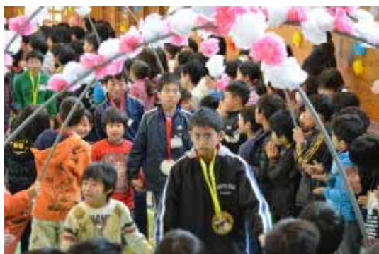
アーチの中を1年生と入場する6年生

早いもので平成23年度も残りわずかとなりました。お 陰様で子どもたちは、保護者、地域の皆様に温かく見守 られ、本年度も充実した1年を過ごすことができました。 授業や行事への御協力、各種PTA活動への御参加、地 域での安全立哨等々、様々な形で本校の教育活動に御 理解と御協力をいただきましたことに、心より感謝申し上 げます。