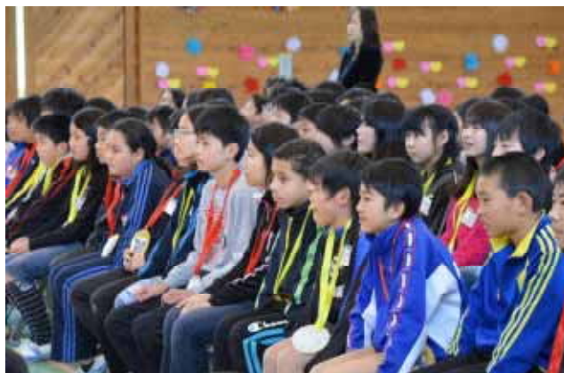
下級生の出し物に見入る6年生