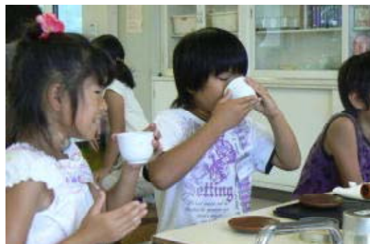
見事な手つきでお茶をいただく