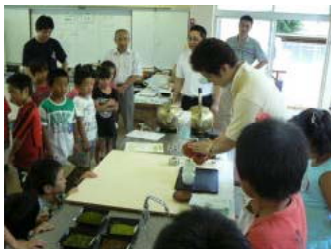
増井さんの実演に見入る