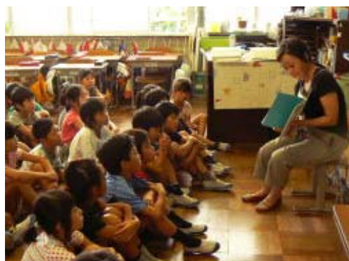
物語の世界に浸る至福の時間

本校では、子どもたちが本の世界に親しむことを願い、読み聞かせ活動を実施しています。本年度は、地域から総勢19人の皆さんが、年間9回の読み聞かせボランティアに御協力くださっています。